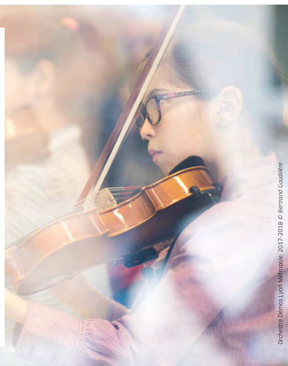
Orchestre Dèmos Lyon Métropole, 2017-2018

fondation | philharmonique Cercle des mécènes de l'Auditorium-Orchestre national de Lyon